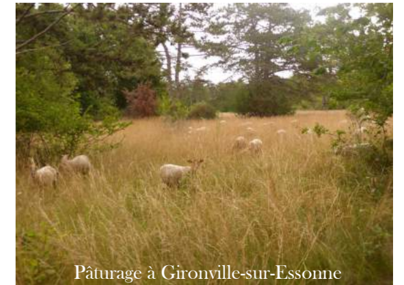
Pâturage à Gironville-sur-Essonne

Pour cela, NaturEssonne a fait appel à la Ferme de Beaumont, ouvrant ainsi la voie à un retour du pâturage en Essonne. Cette pratique permettait historiquement d'entretenir les pelouses calcaires.