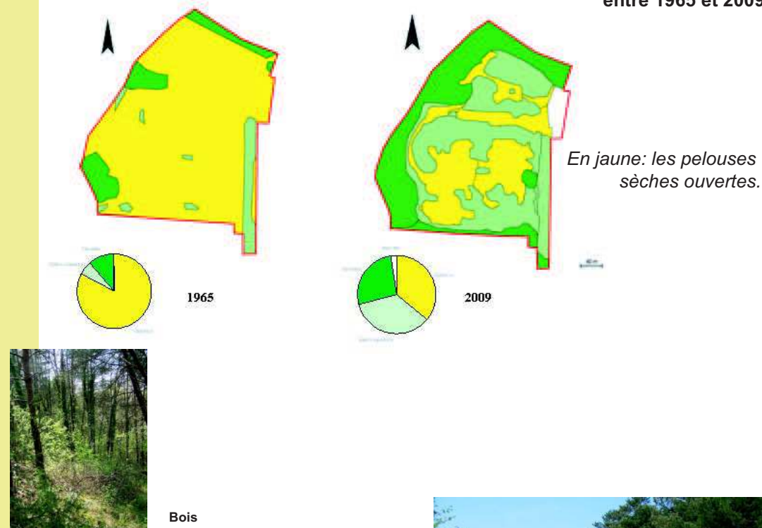
Evolution de la végétation sur le sous-site "Garenne de chateloup" à Fontaine-la-Rivière entre 1965 et 2009