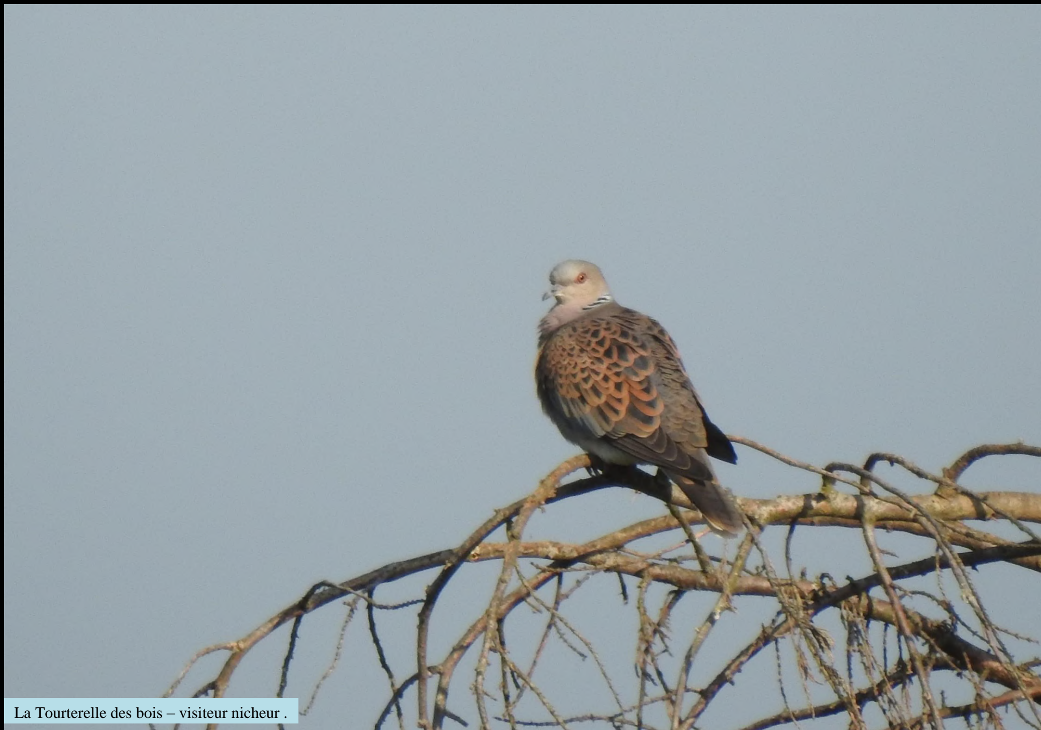
La Tourterelle des bois – visiteur nicheur .