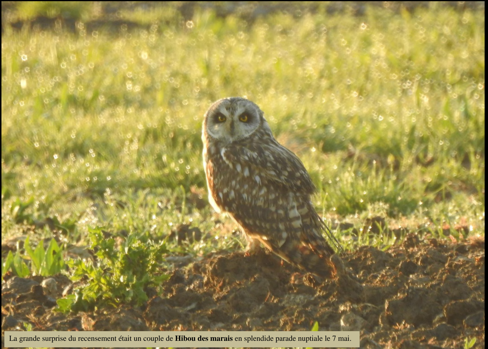
La grande surprise du recensement était un couple de Hibou des marais en splendide parade nuptiale le 7 mai.