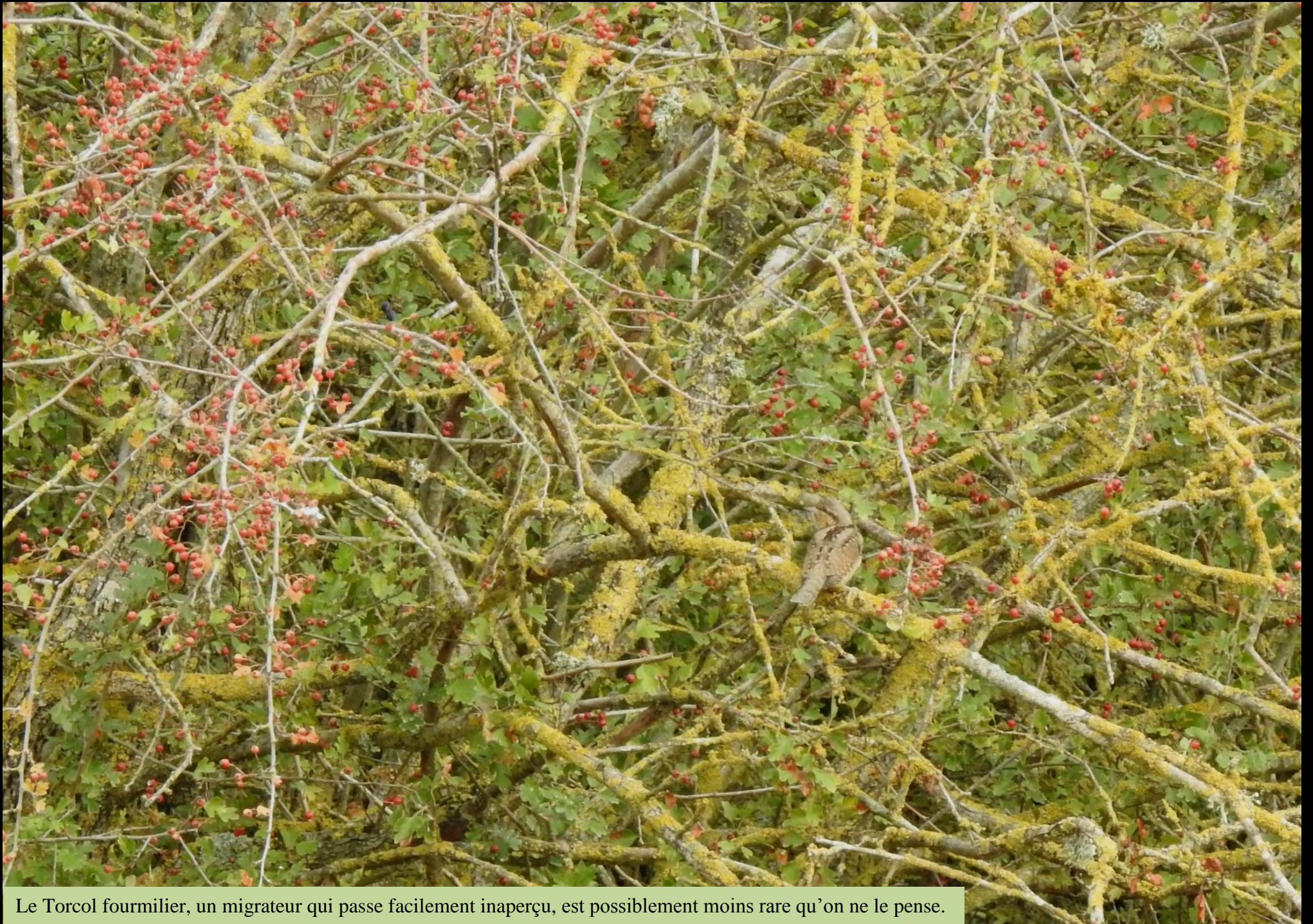
Le Torcol fourmilier, un migrateur qui passe facilement inaperçu, est possiblement moins rare qu'on ne le pense.