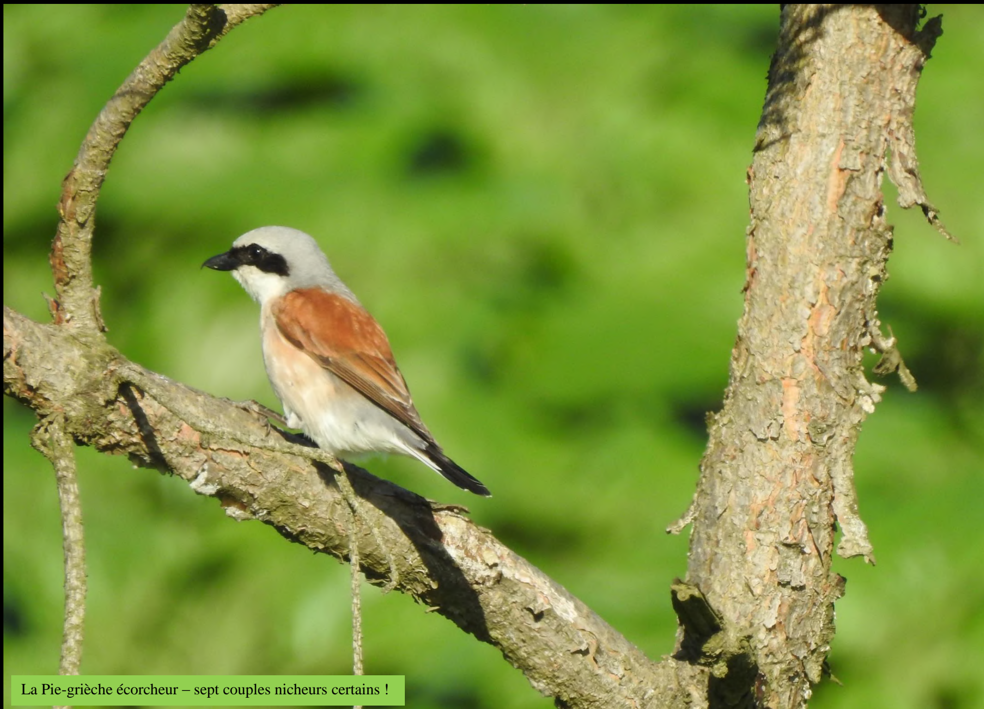
La Pie-grièche écorcheur – sept couples nicheurs certains !