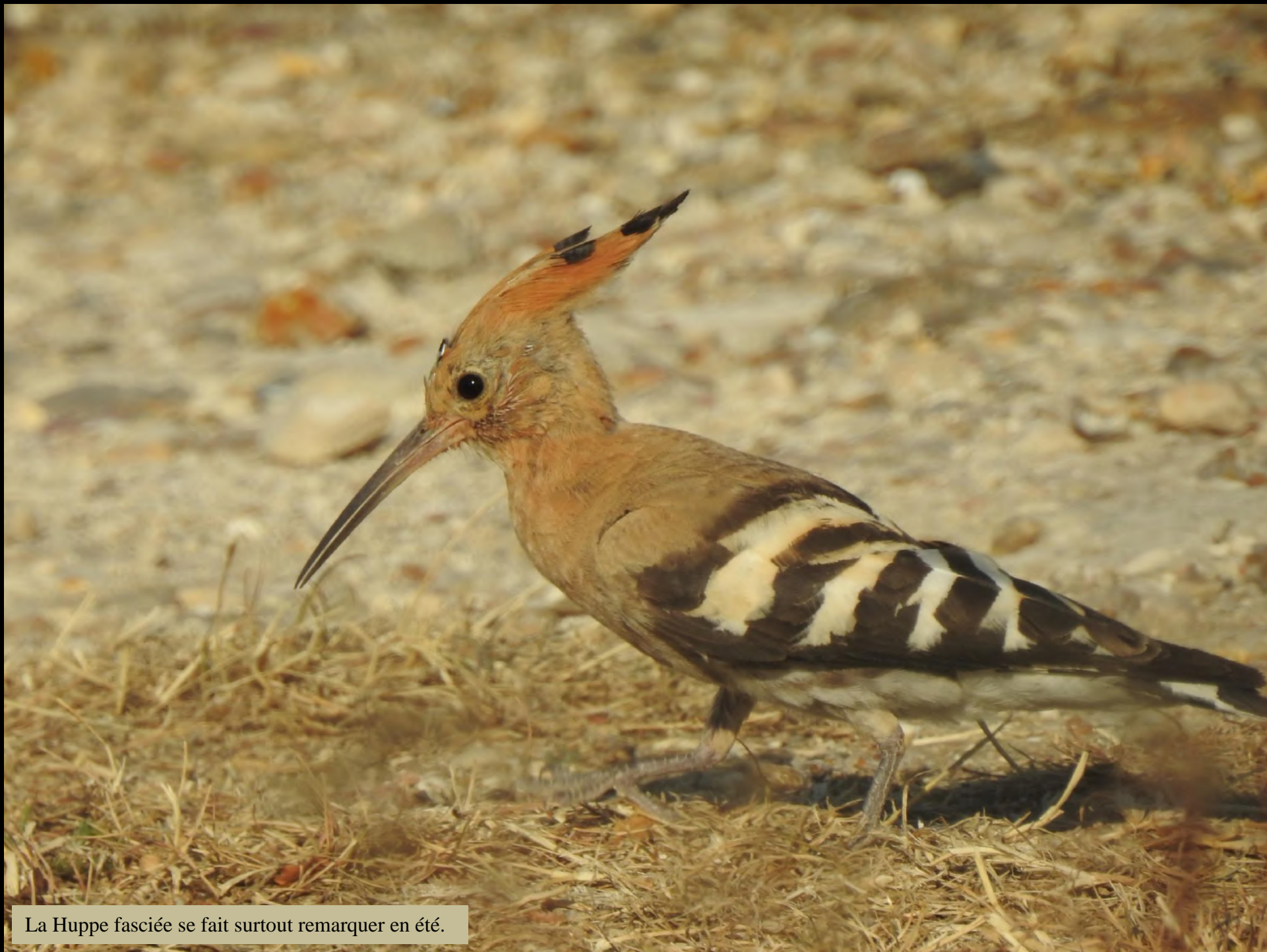
La Huppe fasciée se fait surtout remarquer en été.