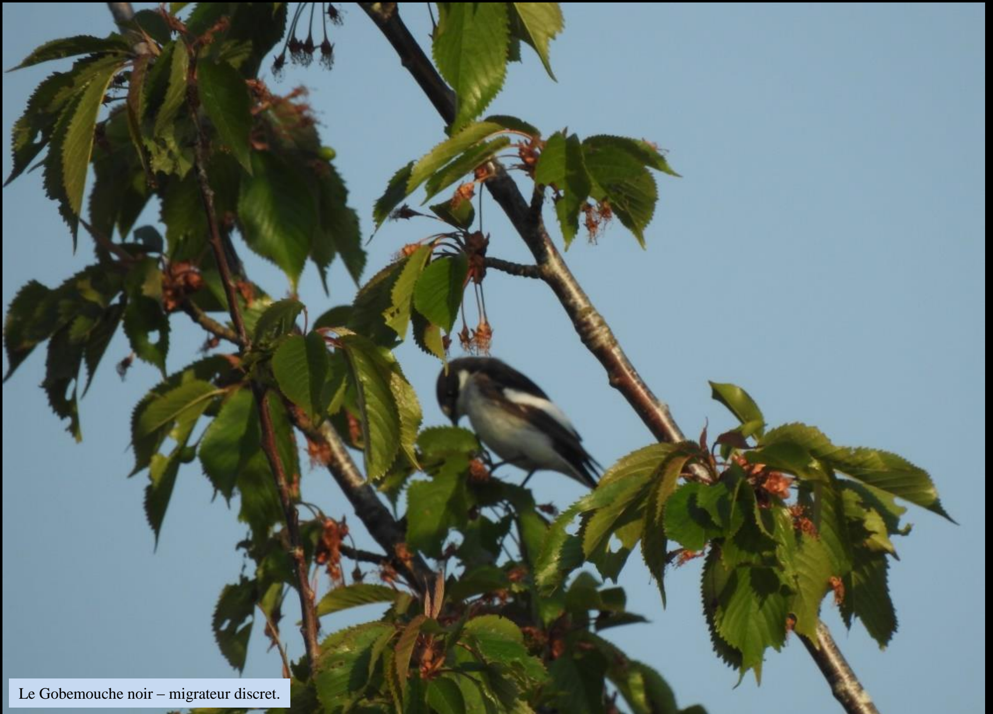
Le Gobemouche noir – migrateur discret.