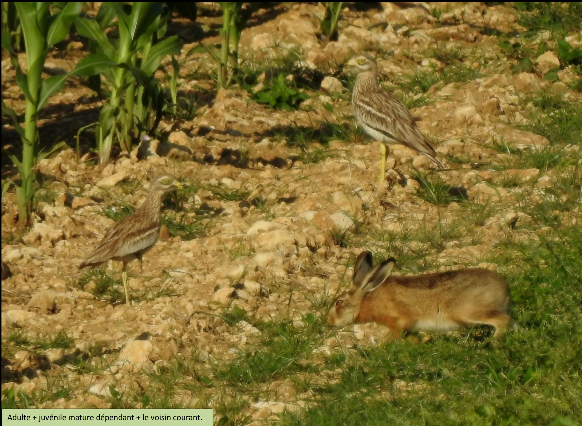
Adulte + juvénile mature dépendant + le voisin courant.