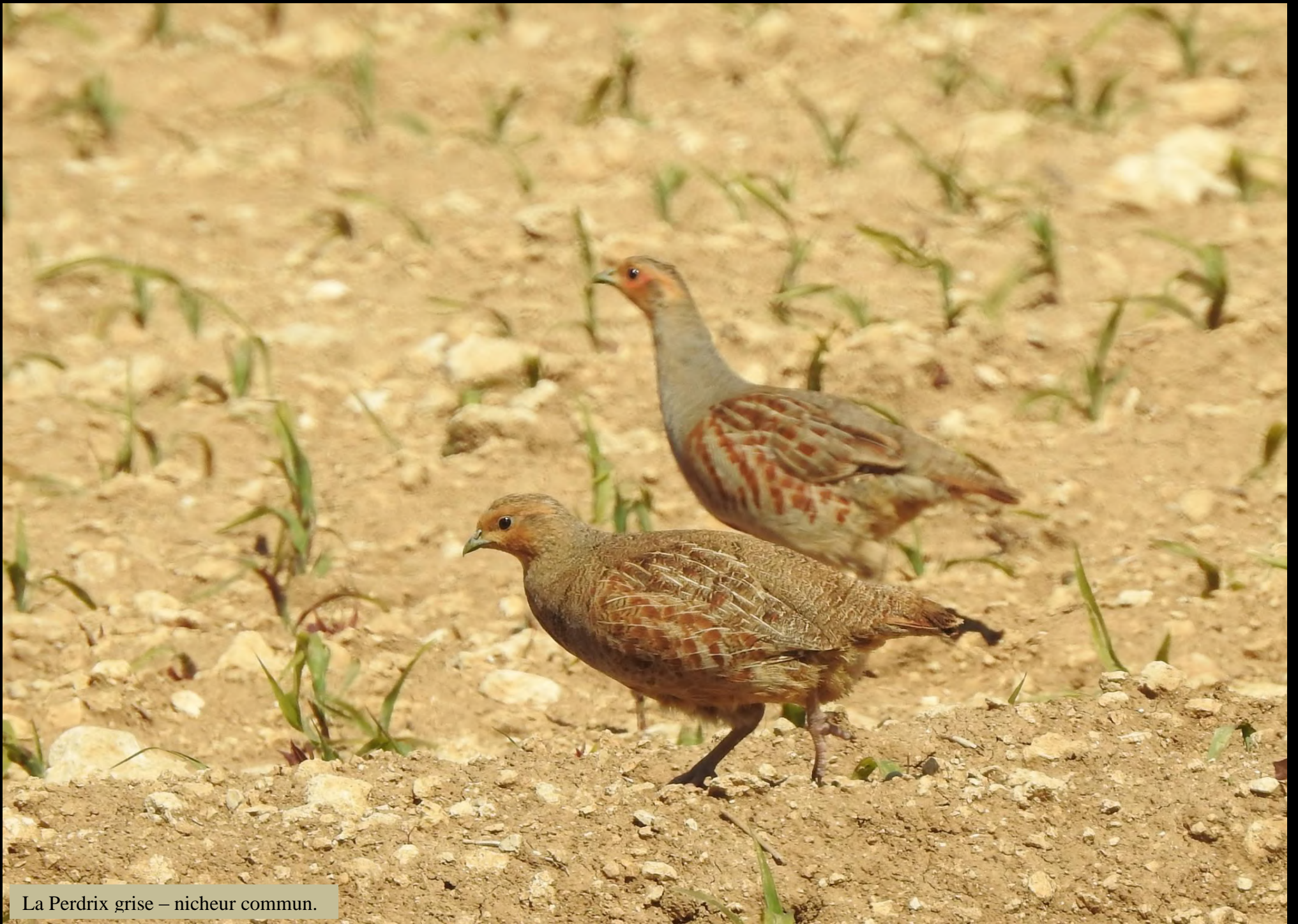
La Perdrix grise – nicheur commun.