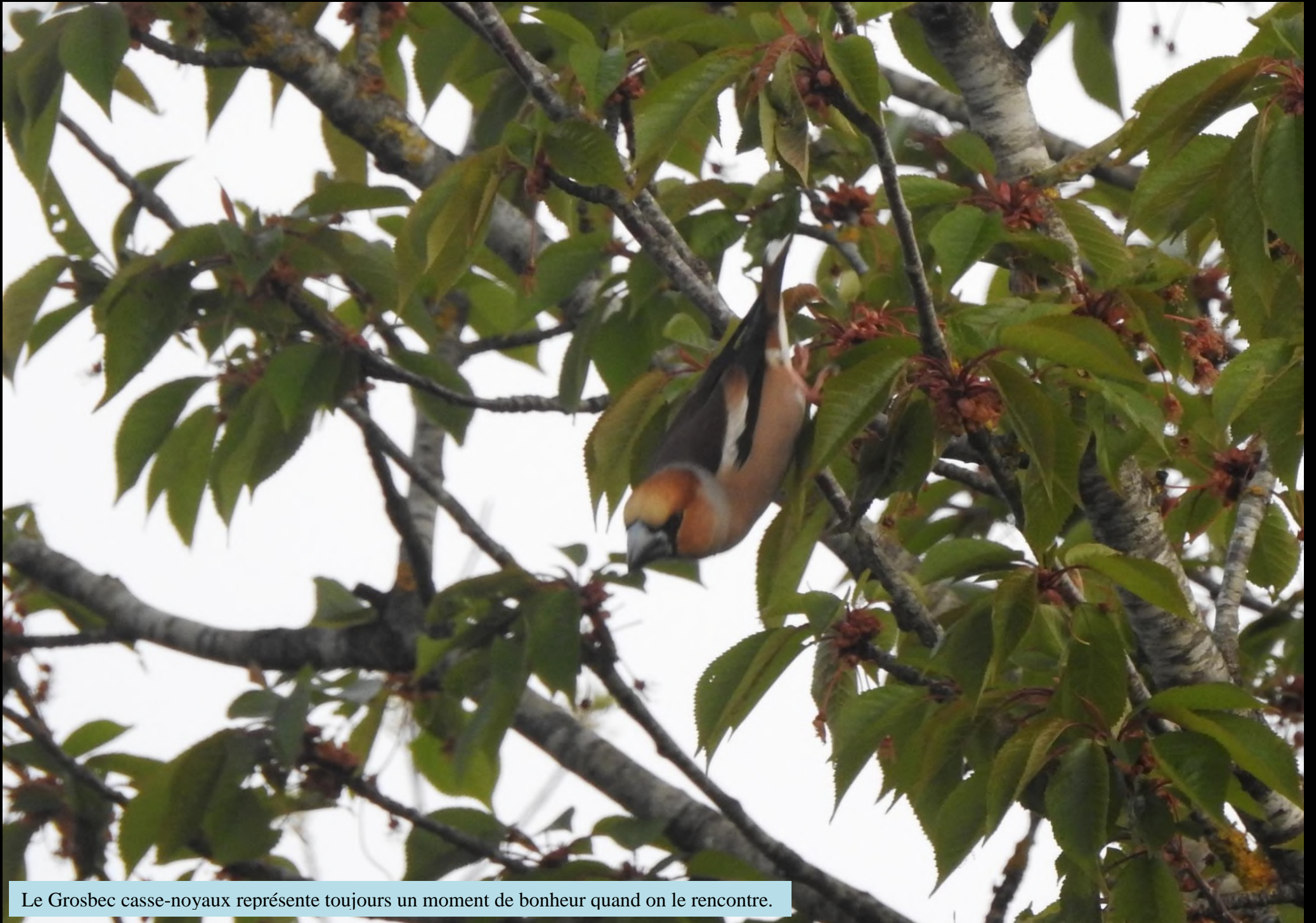
Le Grosbec casse-noyaux représente toujours un moment de bonheur quand on le rencontre.