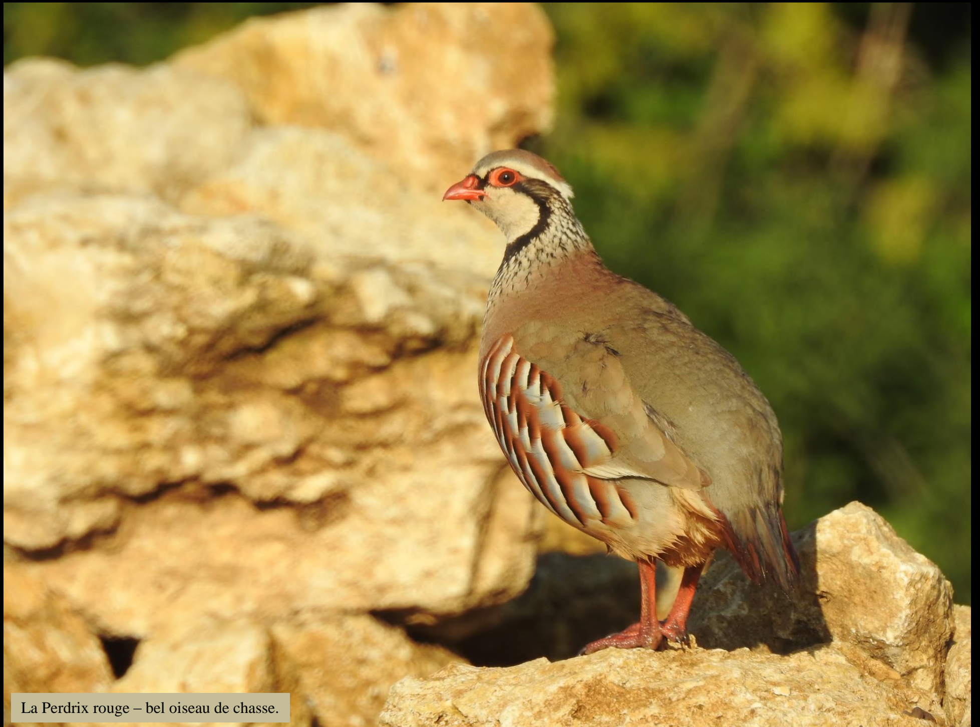
La Perdrix rouge – bel oiseau de chasse.