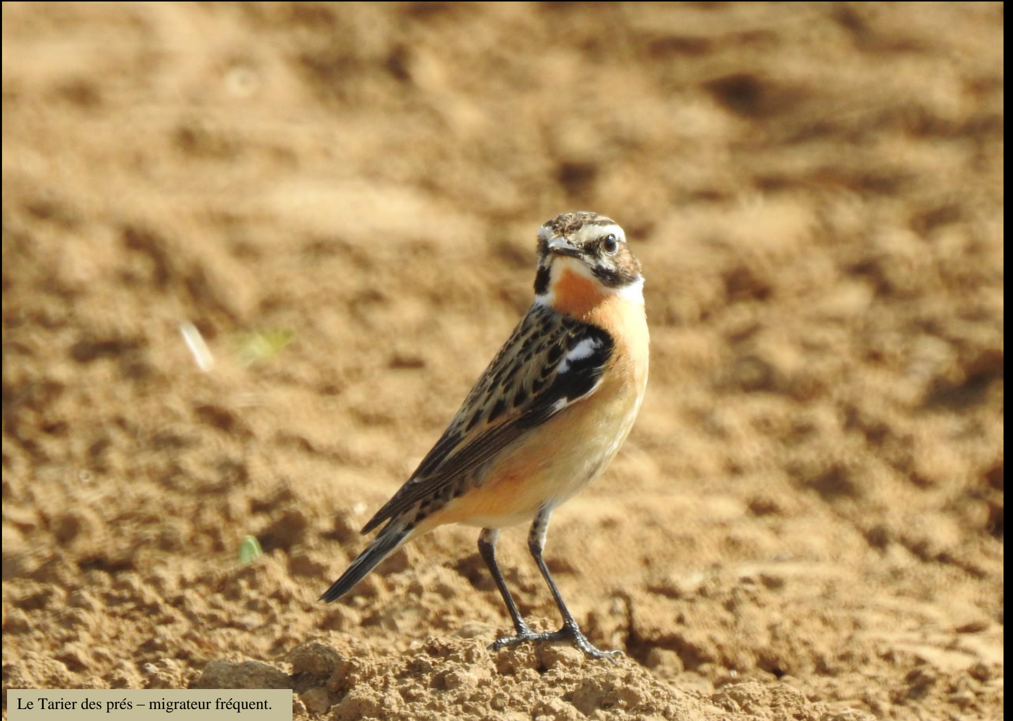
Le Tarier des prés – migrateur fréquent.