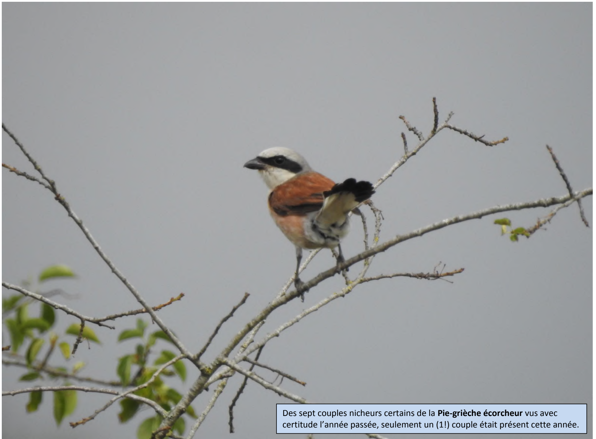
Des sept couples nicheurs certains de la Pie-grièche écorcheur vus avec certitude l'année passée, seulement un (1!) couple était présent cette année.