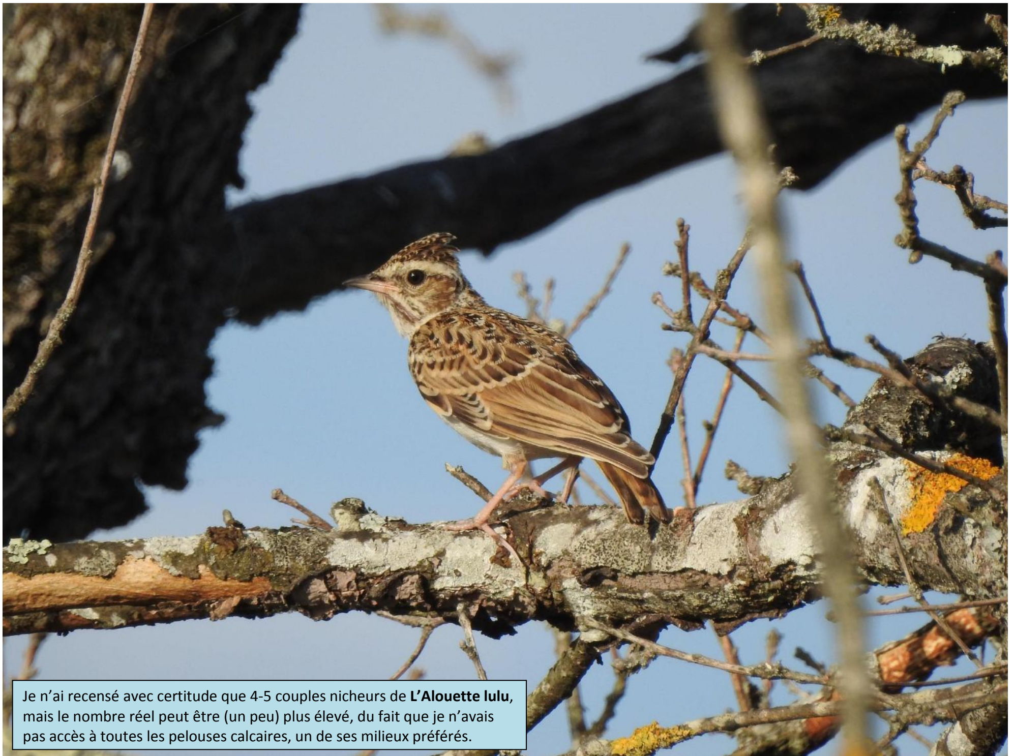
Je n'ai recensé avec certitude que 4-5 couples nicheurs de L'Alouette lulu , mais le nombre réel peut être (un peu) plus élevé, du fait que je n'avais pas accès à toutes les pelouses calcaires, un de ses milieux préférés.