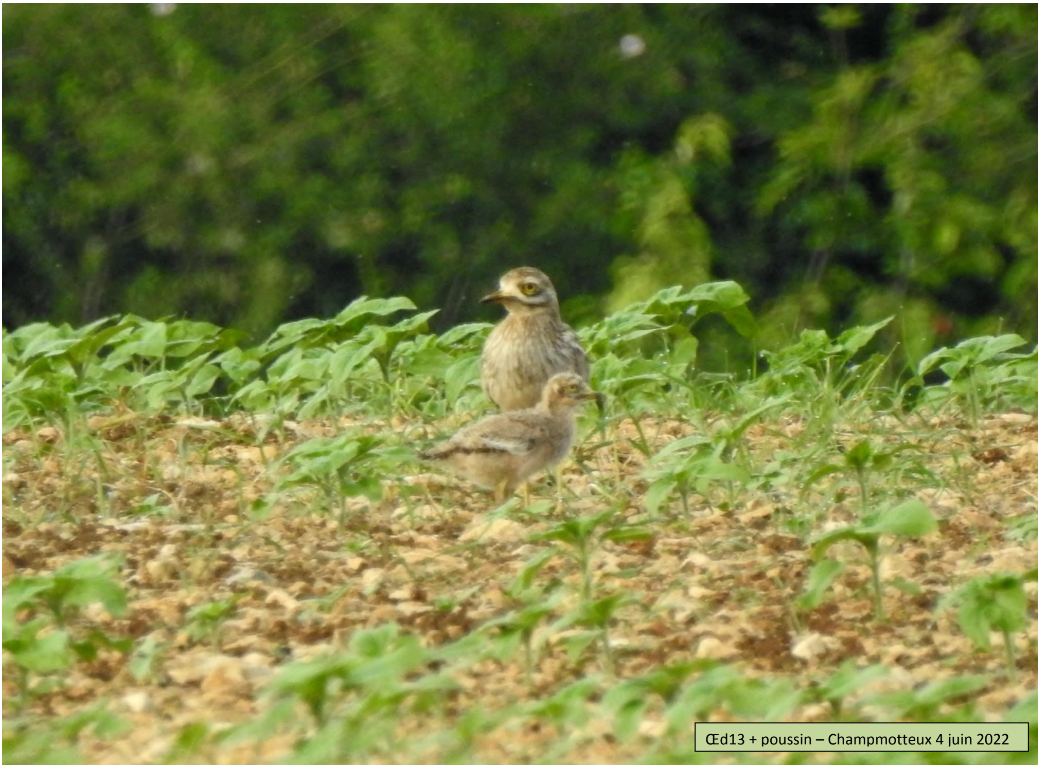
Œd13 + poussin – Champmotteux 4 juin 2022