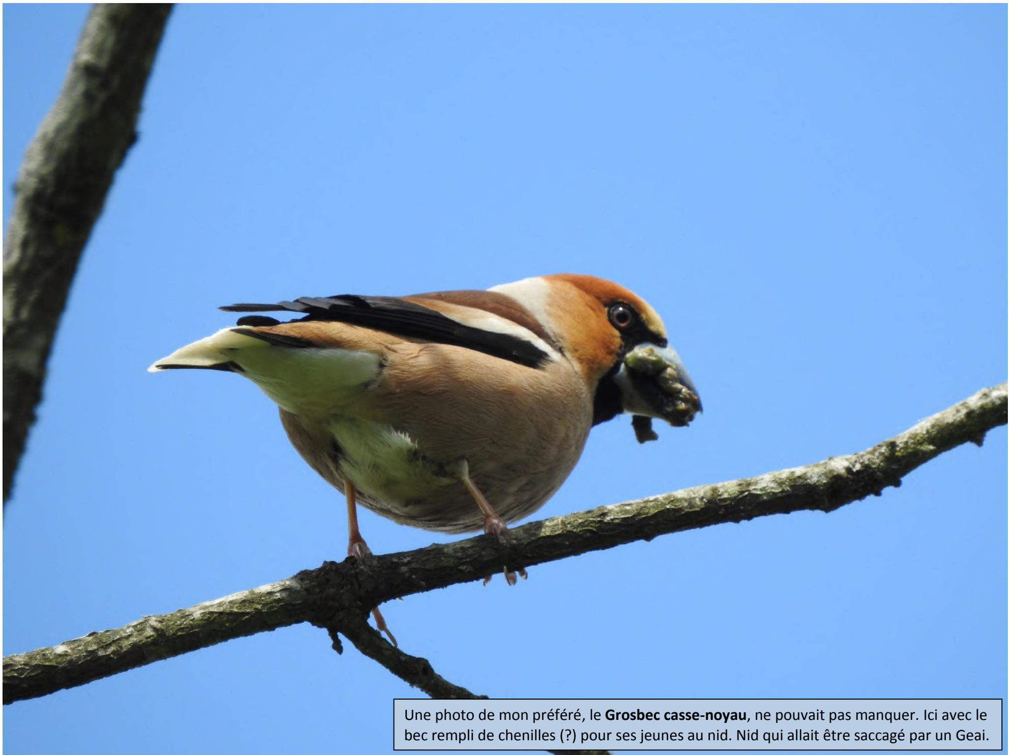
Une photo de mon préféré, le Grosbec casse-noyau , ne pouvait pas manquer. Ici avec le bec rempli de chenilles (?) pour ses jeunes au nid. Nid qui allait être saccagé par un Geai.