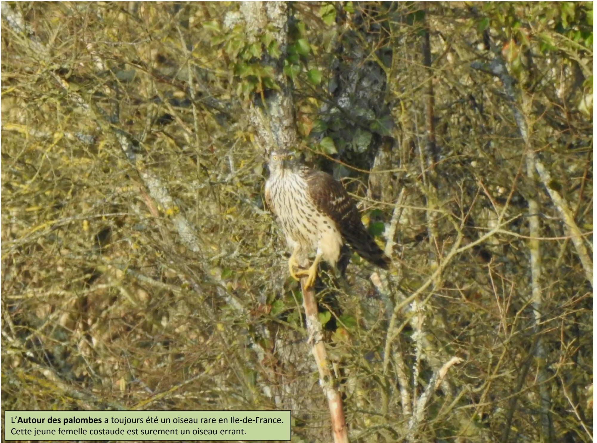
L' Autour des palombes a toujours été un oiseau rare en Ile-de-France. Cette jeune femelle costaude est sûrement un oiseau errant.