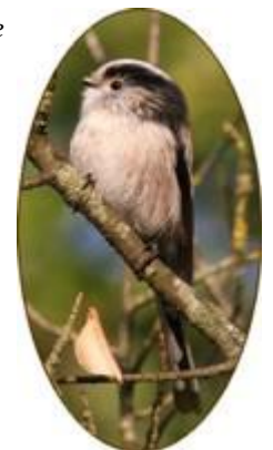
Orite à longue queue

Grèbe castagneux, Grèbe huppé, Grand Cormoran, Héron cendré, Cygne tuberculé, Bernache du Canada, Sarcelle d'hiver, Canard colvert, Fuligule milouin, Gallinule poule-d'eau, Foulque macroule, Bécassine des marais, Mouette rieuse, Pigeon ramier, Perruche à collier, Bergeronnette des ruisseaux, Troglydte mignon, Accenteur mouchet, Rougegorge familial, Merle noir, Roitelet sp, Orite à longue queue, Mésange bleue, Mésange charbonnière, Grimpeur des jardins, Geai des chênes, Pie bavarde, Corneille noire.