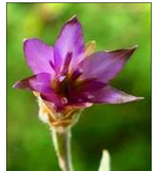
Xeranthème fétide ( Xeranthemum cylindraceum Sm.)