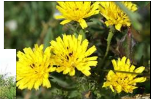
Picride fausse épervière