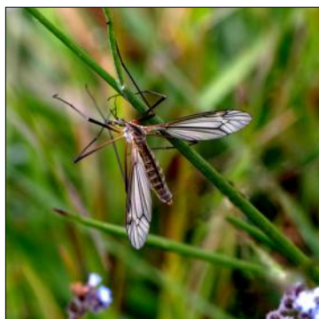
Ordre des Diptera Famille des Tipulidae Espèce : Tipule printanière Tipula veridalis

Ressemble à un gros moustique, mais ne pique pas. Alors que les adultes s'alimentent principalement de nectar, les larves vivent au sol et se nourrissent, de tiges et de racines de végétaux.