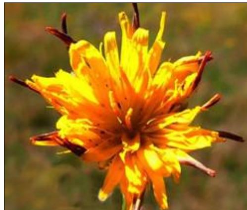
Chondrilla à tige de jonc ( Chondrilla juncea L.)