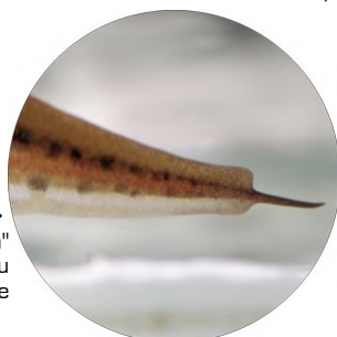
L'étonnant rétrécissement ou "mucron" au bout de la queue est caractéristique du Triton palmé mâle