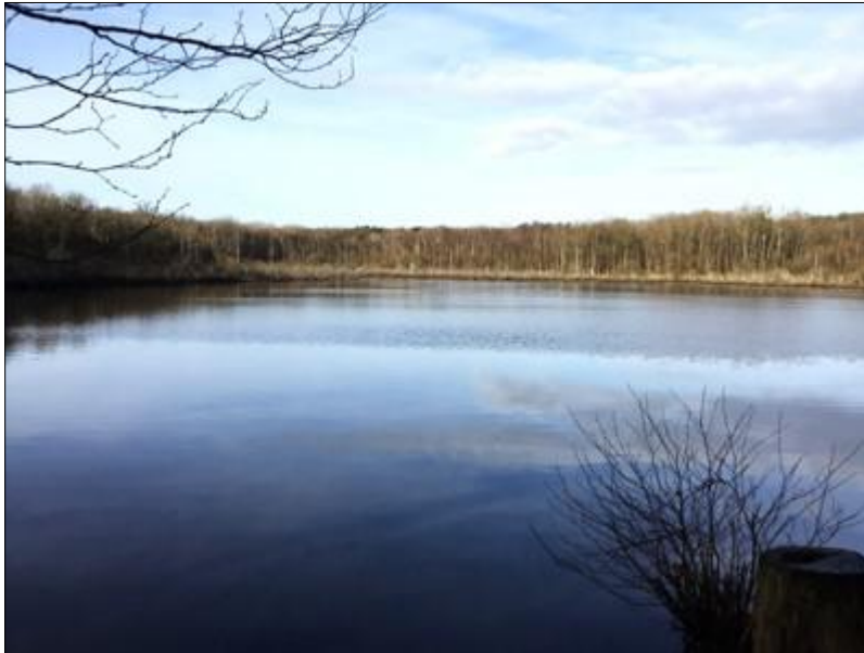
Étang de la Baleine, vu depuis le chemin forestier