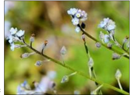
Myosotis des champs

Toutefois, force est de constater que certaines espèces ont bien tiré leur épingle du jeu, comme par exemple le Myosotis des champs , le Cirse des champs ou la Clématite vigne blanche et d'une manière générale les espèces nitrophiles