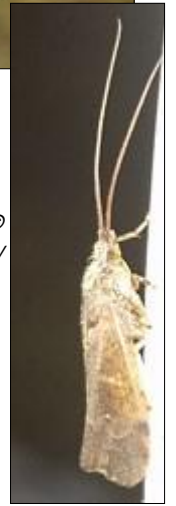
Texte et photos © Frédéric Jarry