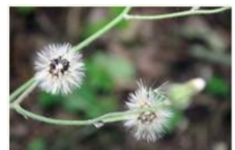
Graines de l'épervière des murs (formation sans fécondation)

En conclusion, Jean-Luc explique pourquoi les classifications (nomenclatures taxonomiques) sont périodiquement modifiées : une découverte dans l'une des disciplines peut remettre en cause le découpage précédemment admis.