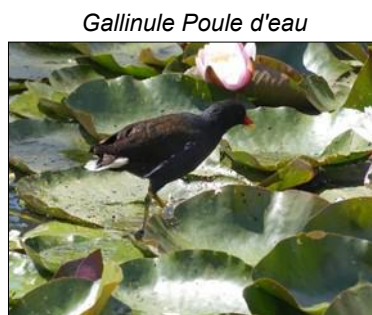
Gallinule Poule d'eau