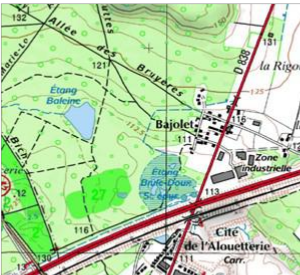
Localisation des étangs de la Baleine et Brûle-Doux