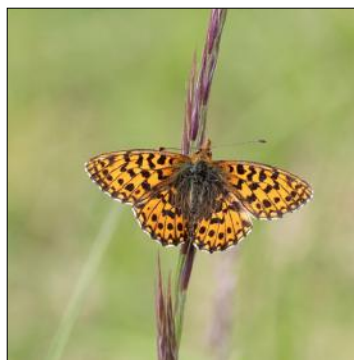
Ordre des Lepidoptera Famille des Nymphalidae Espèce que l'on voit voler toute l'année en plusieurs générations (2à3). L'adulte butine différentes plantes à fleurs. Les chenilles se nourrissent de diverses variétés de violettes. L'espèce est difficile à identifier aux seuls critères du recto des ailes.

Ressemble à un gros moustique, mais ne pique pas. Alors que les adultes s'alimentent principalement de nectar, les larves vivent au sol et se nourrissent, de tiges et de racines de végétaux.