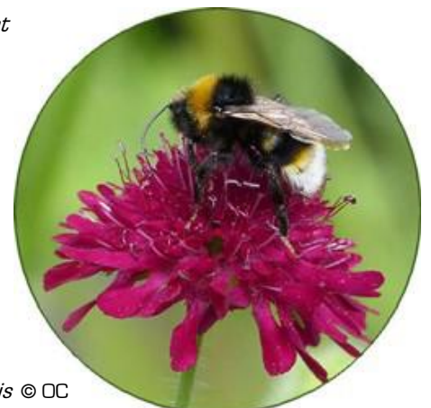
Bombus vestalis

Selon le groupe associatif Estuaire, on en a dénombré environ 200 dans le monde