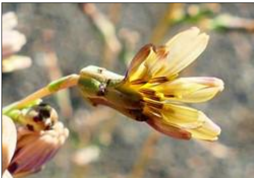
Laitue à feuille de saule ( Lactuca saligna L.)

Elatine major Braun (espèce endémique de la Forêt de Fontainebleau)