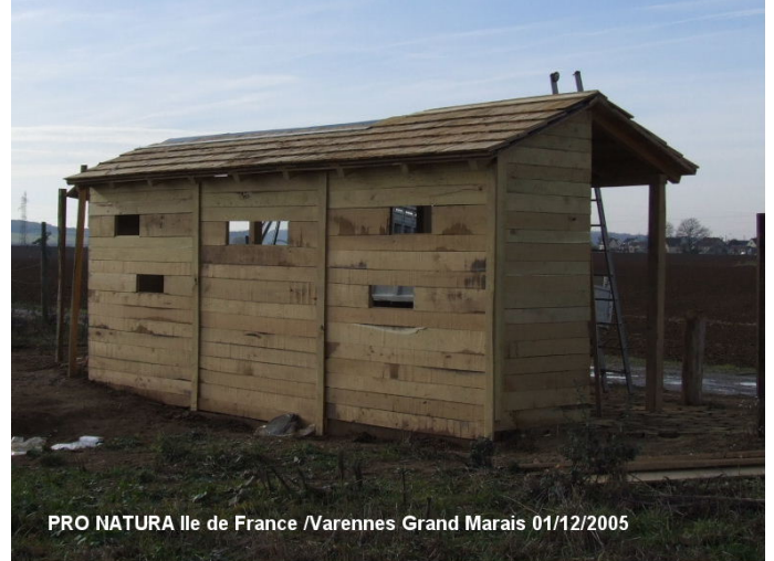
PRO NATURA Ile de France /Varennes Grand Marais 01/12/2005

La conservation de la nature à laquelle se consacrent tous ceux qui font PRO NATURA Ile de France n'est pas une joie qu'ils veulent égoïstes. Ainsi une trentaine d'entre eux, mobilisés par l'ANVL, se sont-ils mis à la pioche un jour de novembre pour habiller d'une haie l'observatoire que PRO NATURA Ile de France a fait construire en bordure du grand marais de Varenne ( photo ci-dessous ). Ainsi les passants, les habitants du quartier voisin pourront admirer les oiseaux sauvages.