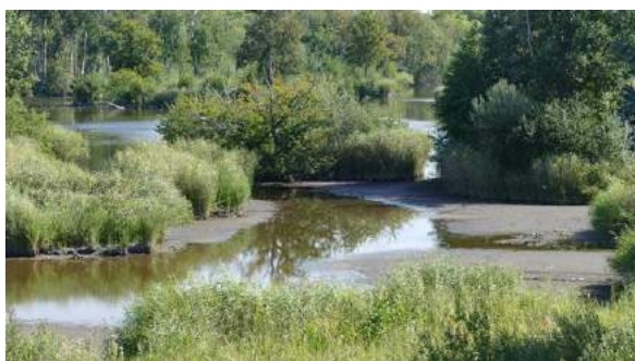
La Tour: Niveau d'eau exceptionnellement bas