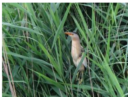
Blongios nain Misery