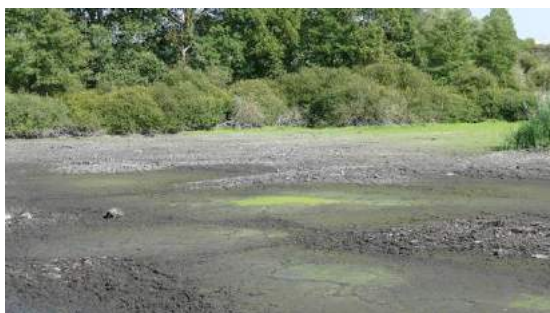
Itteville les Fauvette