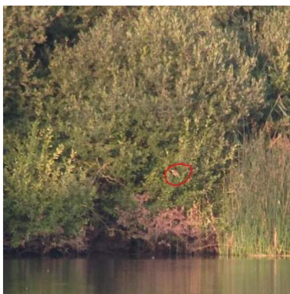
Rive Nord étang neuf Saclay

14 prospections pour un total de 30h45 ont été réalisées sur ce site.