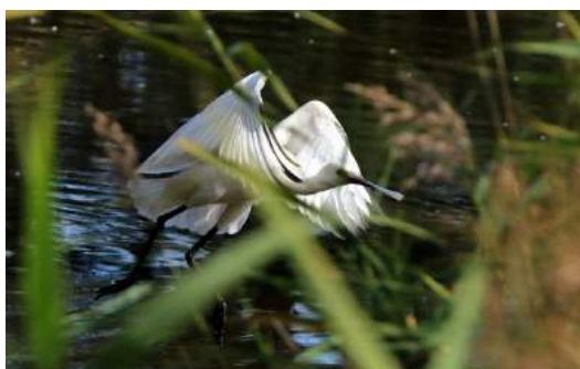
Spatule blanche de passage