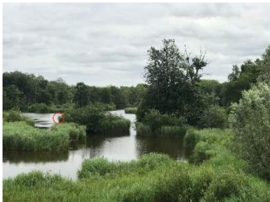
Zone de nidification- Observatoire de la Tour

23 prospections pour 82h45 à l'observatoire des Gravelles et 42 prospections pour 161h55 à celui de la Tour seront réalisées par les bénévoles.