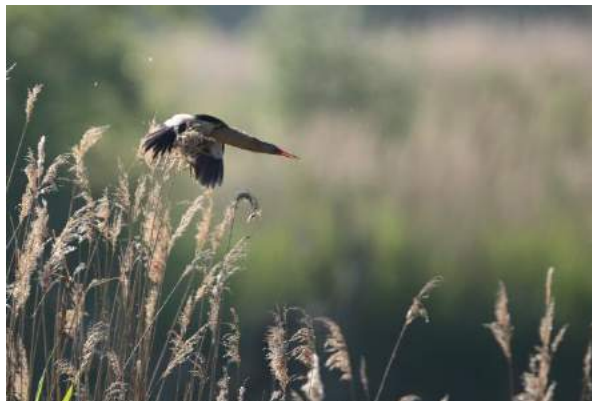
1ère observation Blongios nain mâle