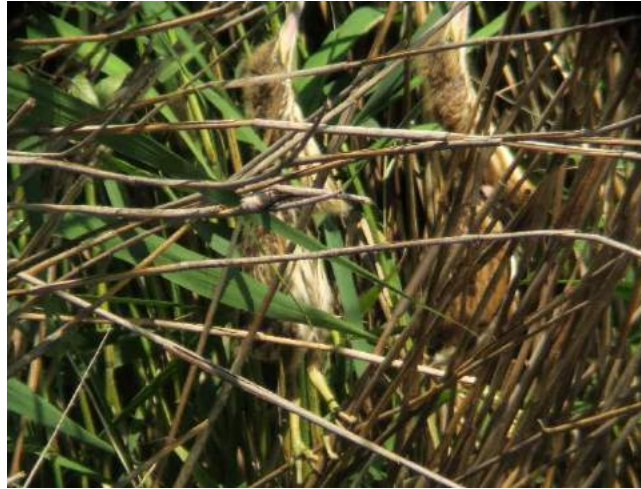
Blongios juvéniles

Depuis 1997, l'association NaturEssonne assure un suivi de la population de Blongios nain en Essonne afin de mieux connaître sa répartition, son comportement, sa nidification et ainsi participer à sa préservation. Un suivi régulier des effectifs du Blongios nain, avec le soutien du Conseil départemental de l'Essonne, est assuré d'avril à septembre par des adhérents de l'association.