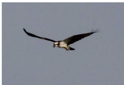
Balbuzard pêcheur

Observatoire de la roselière: Cet observatoire permet des observations sous un autre angle et dans une zone fréquentée par de nombreux oiseaux.