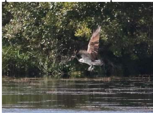
Fontenay le Vicomte – Les Moines

Observatoire des Moines: Quelques observations intermittentes ont été réalisées sur ce site fréquenté quelques fois par le Balbuzard pêcheur mais pas par le Blongios.