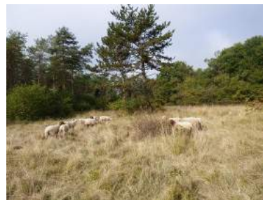
Pâturage en cours

Les pelouses calcicoles sont des milieux rares. Leur disparition est principalement liée à l'abandon du pastoralisme. En effet, en l'absence d'entretien, ces milieux caractérisés par une végétation herbacée, vont naturellement évoluer vers une végétation ligneuse composée d'arbres et d'arbustes. En se nourrissant des jeunes pousses, les moutons permettent d'entretenir et de maintenir les milieux ouverts de pelouse, en empêchant la densification du tapis herbacé par les graminées (premier stade d'évolution des pelouses calcaires vers le boisement).