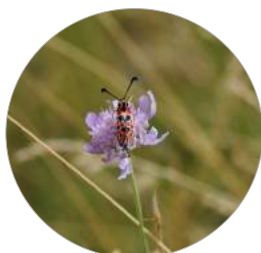
Zygène de la petite coronille ( Zygaena fausta ) Très rare en Ile-de-France **