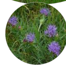
Cardoncelle molle ( Carthamus mitissimus ) Rare en Ile-de-France *

* : Flore d'Île-de-France, Jauzein & Nawrot 2011 / ** : Liste Rouge Régionale des Rhopalocères et Zygaenocères et Zygaènes d'Île-de-France, coord. Dewulf (Natureparif) & Hourard (Opie) 2016. Imprimée par Rubrik C - Décembre 2021.