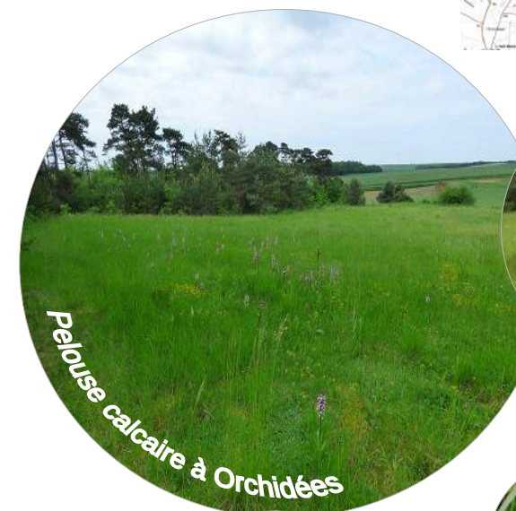
Pelouse calcaire à Orchidées