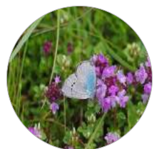
Azuré des cytises ( Glaucopsyche alexis ) Assez rare en Ile-de-France **