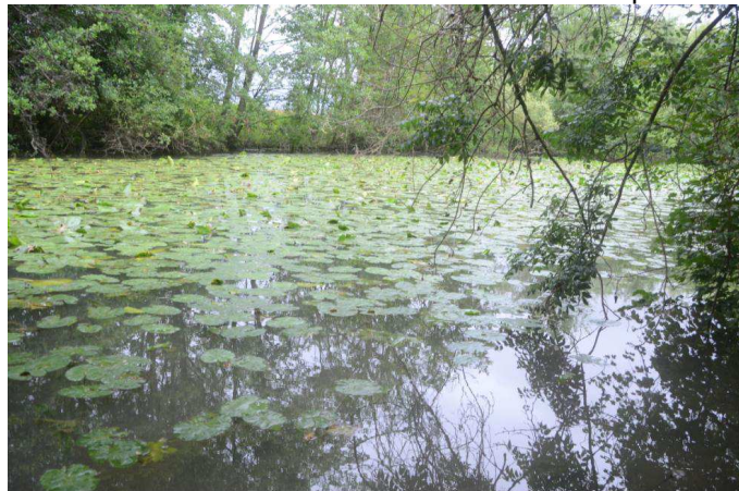
en Bassée, la noue de Neuvry, à Bray sur Seine

L'une, de 2 ha 40 en bordure de noue (petite rivière) est une mégaphorbiaie actuellement dégradée par une ancienne plantation de peupliers aujourd'hui en ruine et qu'il est prévu de restaurer. Ce devrait déjà être fait, mais la crue de la Seine et de ses affluents en ce printemps 2016 a recouvert le terrain rendant son accès impossible