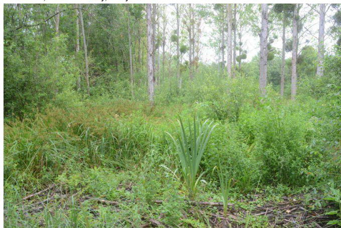
en bordure de la noue de Neuvry à Bray sur Seine : mégaphorbiaie