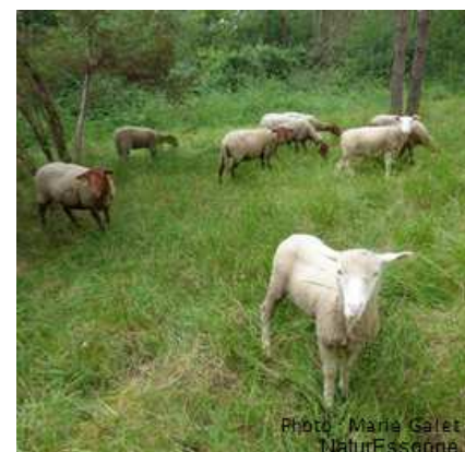
dans l'espace naturel des grandes friches à Gironville sur Essonne

Autre avantage, ce pâturage est apprécié par les habitants des communes concernées : les plus anciens retrouvent le paysage de leur enfance et sont heureux de le montrer à leurs petits enfants