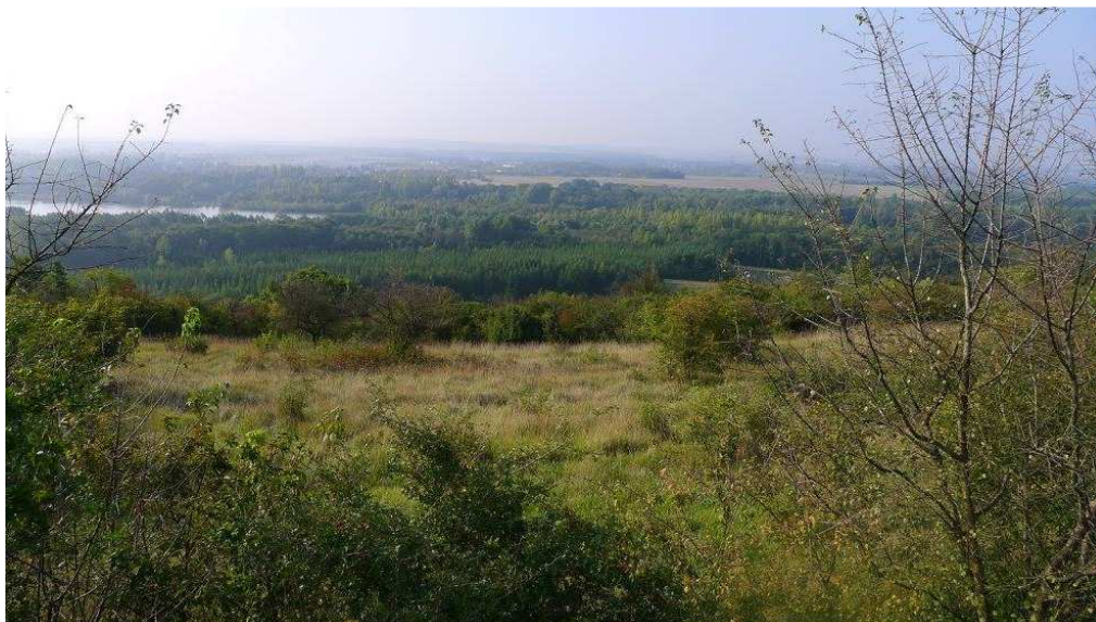
la pelouse de Tréchy et vue sur la Bassée (vallée de la Seine)